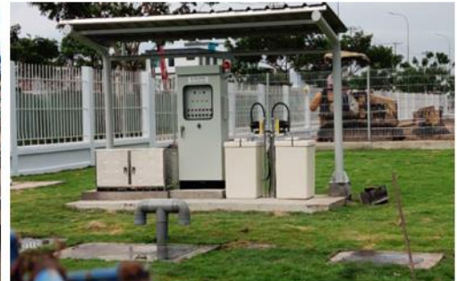
コントロールパネルと注入設備