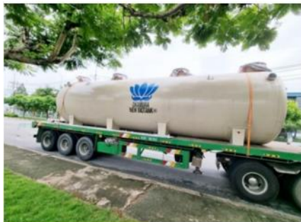
OKAMURA NEW BIOTANK

タイ現地法人 [OKAMURA INDUSTRY (THAILAND) CO., LTD.] TEL +662-925-9241-2 FAX +662-925-9243 ベトナム現地法人 [OKAMURA VIETNAM CO.,LTD.] TEL&FAX(ベトナム語) +84(0)28-2253-4078 TEL(日本語) +84(0)28-2253-4088