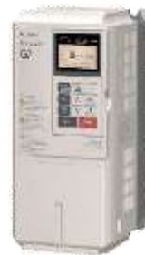
Three-Level Control General-Purpose Inverter with Advanced Vector Control Varispeed G7