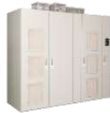
省エネシステム 高圧インバータ