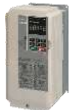
High Performance Vector Control Drive A1000