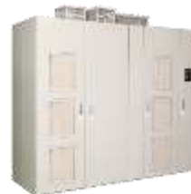
Super Energy Saving Medium Voltage Inverter FSDrive-MV1000 (3 kV, 6 kV, 11 kV)