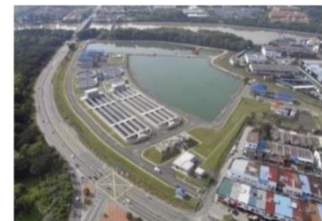
マレーシア国下水処理場