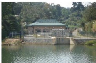
スリランカ国取水施設