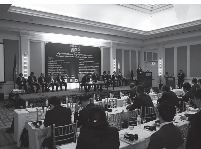
日本カンボジア上下水道セミナーを開催(2018年)