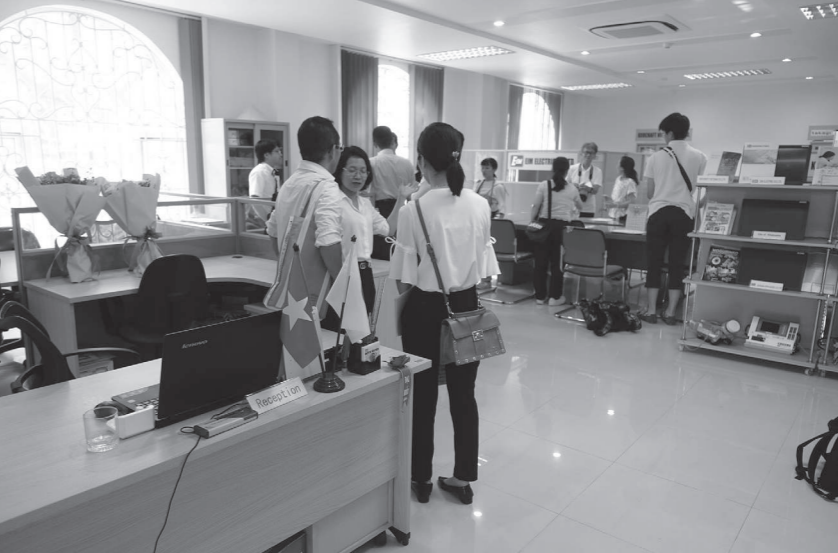
ベトナム・ハイフォン市の北九州市海外事業サポートセンター