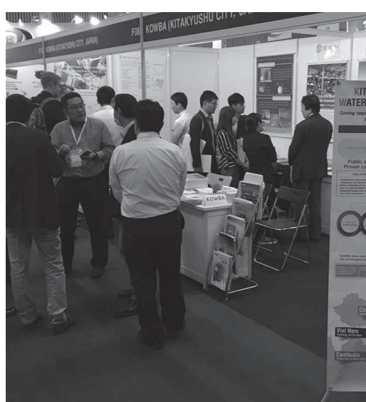
ベトナムウォーター 2019に出展

「中期経営計画」で、技術力や経験を活かし、国際貢献の推進を掲げており、これをさらに向上させ、これらをもとに上下水道分野の国際技術協力を位置付けています。北九州市の海外展開は、2019年に官民双方の期待を担ってKOWBAは設立されました。以来、行政と民間が一体となって海外ビジネスを推進しています。 中西局長 2010年のKOWBA設立当時、地球温暖化が取りざたされ、人口増加による世界的な水資源の枯渇と必要の増加が問題となっていました。 一方、経済発展に伴う経済産業省が官民連携による海外展開を推進する8月31日でした。同年11月には、ベトナム・ハイフォン市で「海外水インフラPPP協議会」を設立しました。 KOWBAは、官民連携による海外水ビジネスの積極的な推進のため、海外の現地ニーズの調査や把握、会員及び関係機関との相互の情報交換と、その共有を目的に設立されました。私自身は、KOWBA設立当初から会員として活動に関与してきました。ベトナム、特に中小企業の国際展開において、現地調