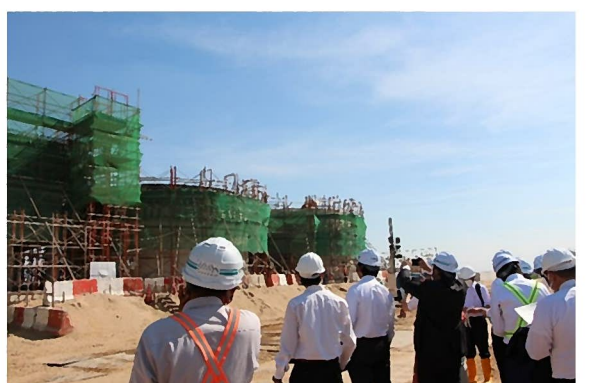
下水処理場建設現場視察