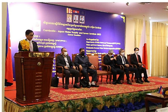
【下水道セッション】開会挨拶