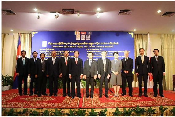
【上水道セッション】VIP 登壇