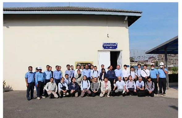
地方公営水道局視察