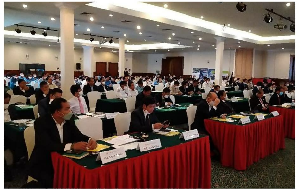
【上水道セッション】セミナーの様子