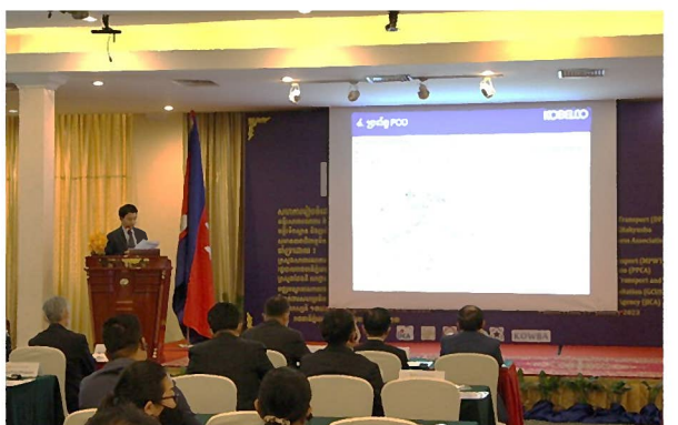
KOWBA 会員企業プレゼン